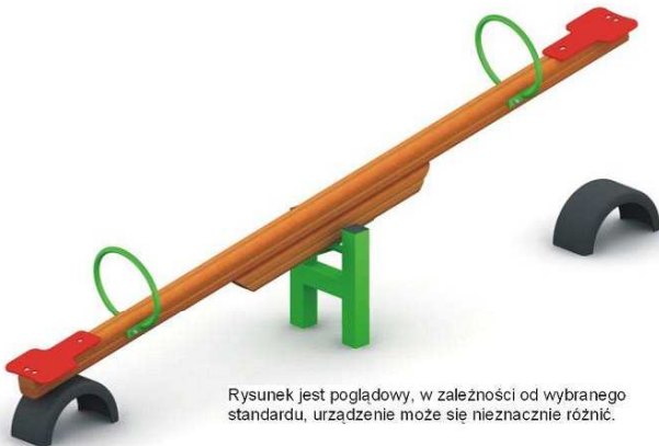
Rysunek jest poglądowy, w zależności od wybranego standardu, urządzenie może się nieznacznie różnić.

Słupy podstawy wykonane są ze stali ocynkowanej malowanej proszkowo, belka wykonana z drewna klejonego o przekroju 90mm x 90mm. Łożysko i uchwyty malowane proszkowo. Siedziska profilowane wykonane z tworzywa sztucznego.